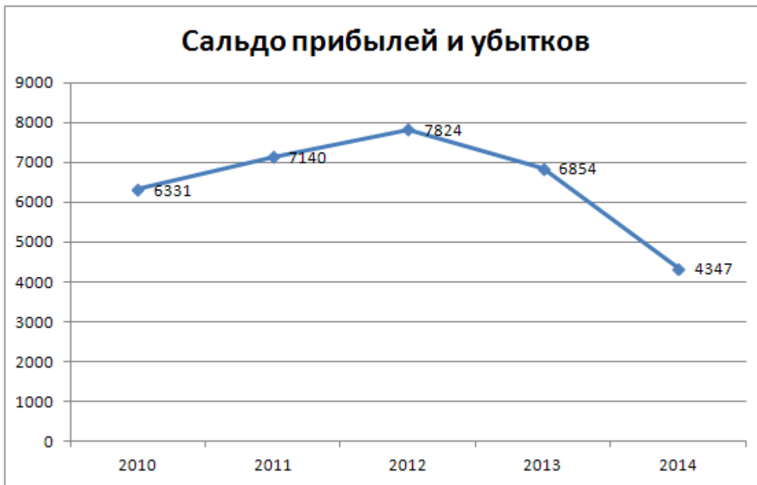
Рисунок 1 — Сальдо прибылей и убытков организаций по Российской Федерации

Данные рисунка свидетельствуют о снижении прибыли предприятий, особенно существенное снижение произошло за последние 2 года.